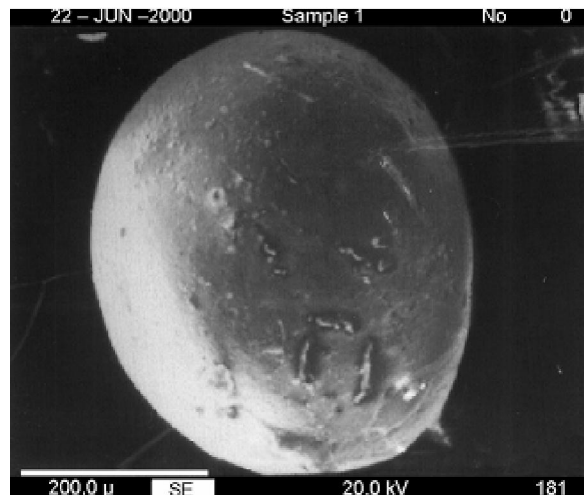
Gambar 1. Scanning electron micrograph dari microsphere kitosan yang diproduksi menggunakan metode ikatan silang emulsi (Agnihotri et al. , 2004).

Pengeringan semprot ( spray drying ) merupakan teknik yang telah dikenal umum digunakan untuk memproduksi tepung, granula atau aglomerat dari campuran obat dan larutan excipien serta suspensi. Metode ini didasarkan pada pengeringan droplet atom dalam aliran udara panas. Di dalam metode ini, pertama-tama kitosan dilarutkan atau didispersikan dalam larutan dan kemudian ditambahkan bahan yang tepat untuk pembentukan ikatan silang. Larutan atau dispersi ini diatomisasi dalam aliran udara panas untuk pembentukan droplet kecil. Dari proses ini, pelarut secara instan menguap dan menghasilkan partikel yang bergerak bebas. Ukuran partikel tergantung pada ukuran nozel, kecepatan aliran semprot, tekanan atomisasi, suhu udara inlet , dan tingkat ikatan silang.